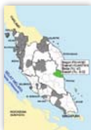
Rajah 2: Contoh Paparan Data

Agensi Anti Dadah Kebangsaan (AADK), 2007. Data peratus penyalahgunaan dadah ini dibuat perbandingan dengan data penduduk bagi membentuk tiga kategori kawasan iaitu Kawasan Putih, Kawasan Kelabu dan Kawasan Hitam.