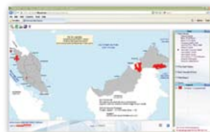
Rajah 3: Peta Kawasan Tumpuan Dadah

Peta Kawasan Tumpuan Dadah pula merujuk kepada kawasan yang padat dengan populasi belia dan kawasan berisiko tinggi dengan dadah. Definisi khusus kawasan tumpuan ini merujuk kepada peratus dadah \geq 0.1 dan peratus belia \geq 40 . Warna merah digunakan bagi mewakili maksud daerah yang terlibat sebagai kawasan tumpuan dadah. Peta ini boleh digunakan oleh pelbagai pihak yang bertanggungjawab terutamanya pentadbir, pembuat dasar dan perancang program sebagai panduan untuk merancang program belia yang bersesuaian dengan memfokuskan kepada kawasan tumpuan dadah.