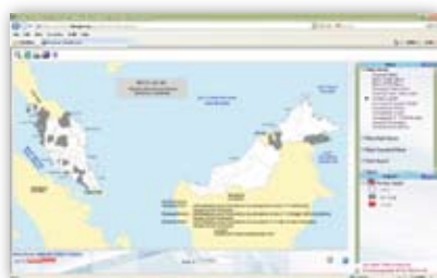
Rajah 1: Peta Peratus Penyalahgunaan Dadah Mengikut Daerah

negeri sebelah Pantai Timur, Selatan dan Sabah dan Sarawak. Pengguna boleh menggunakan tetikus dan diletakkan pada setiap daerah seperti Rajah 2 untuk melihat paparan data peratus belia dan peratus dadah.