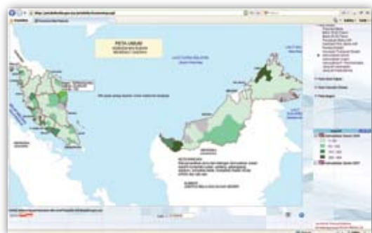
Rajah 1: Peta Kemudahan Sukan (jumlah data akan dipaparkan mengikut kursor)

S iri IV sekali lagi memfokuskan kepada kategori Peta Umum iaitu pemetaan Kemudahan Sukan, Kemudahan Awam dan Kemudahan Pusat Perkhidmatan. Sumber data bagi tiga jenis pemetaan ini merupakan data yang diperolehi daripada Jabatan Belia dan Sukan Negeri (JBSN). Pemetaan Kemudahan Sukan adalah paparan data yang menyenaraikan jenis dan bilangan kemudahan sukan seperti kompleks sukan, padang, gelanggang, stadium, kompleks belia, Kompleks Rakan Muda (KRM) dan lain-lain.