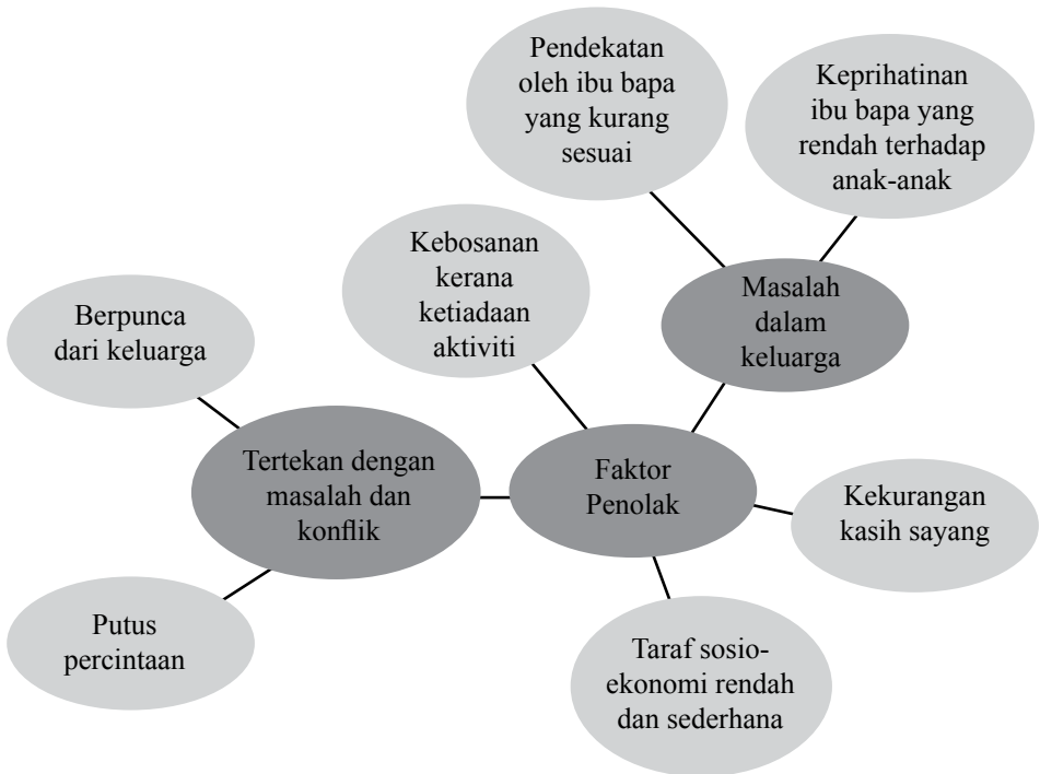
Rajah 2: Faktor penolak mengapa belia merempit

yang lain. Beliau turut menambah, secara keseluruhannya, pelumba jalanan adalah daripada latar belakang yang rendah kepada sederhana. Berdasarkan daripada perbincangan dan huraian hasil kajian, Rajah 2 berikut menunjukkan rangkuman faktor penolak fenomena 'rempit' dalam kalangan belia: